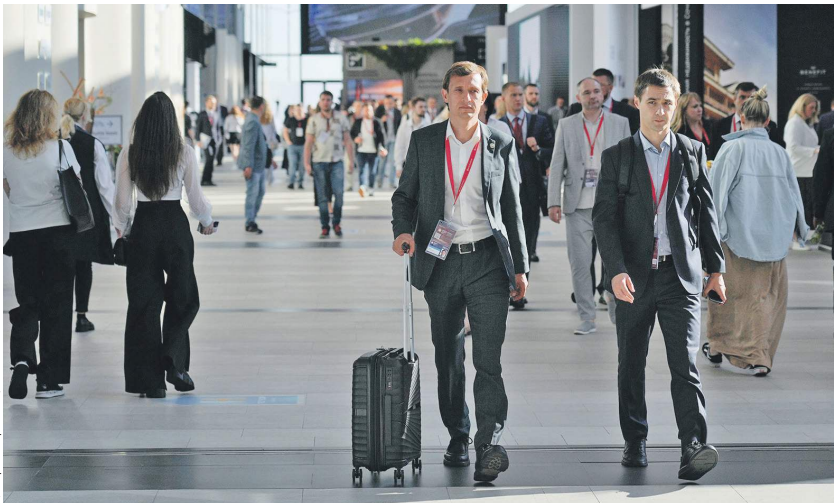
Дмитрий Корсаков / «Известия»

лярного мира и новых точек экономического роста. По словам Антона Кобякова, в ПМЭФ приняли участие 21,3 тыс. человек из 139 стран — это 3,5 тыс. российских и иностранных компаний. На форум приехали зарубежные делегации из 95 стран, в том числе 63 главы дипкорпусов и 48 министров. Мероприятия освещали 4,2 тыс. отечественных и зарубежных журналистов. «Это много», — отметил Антон Кобяков.