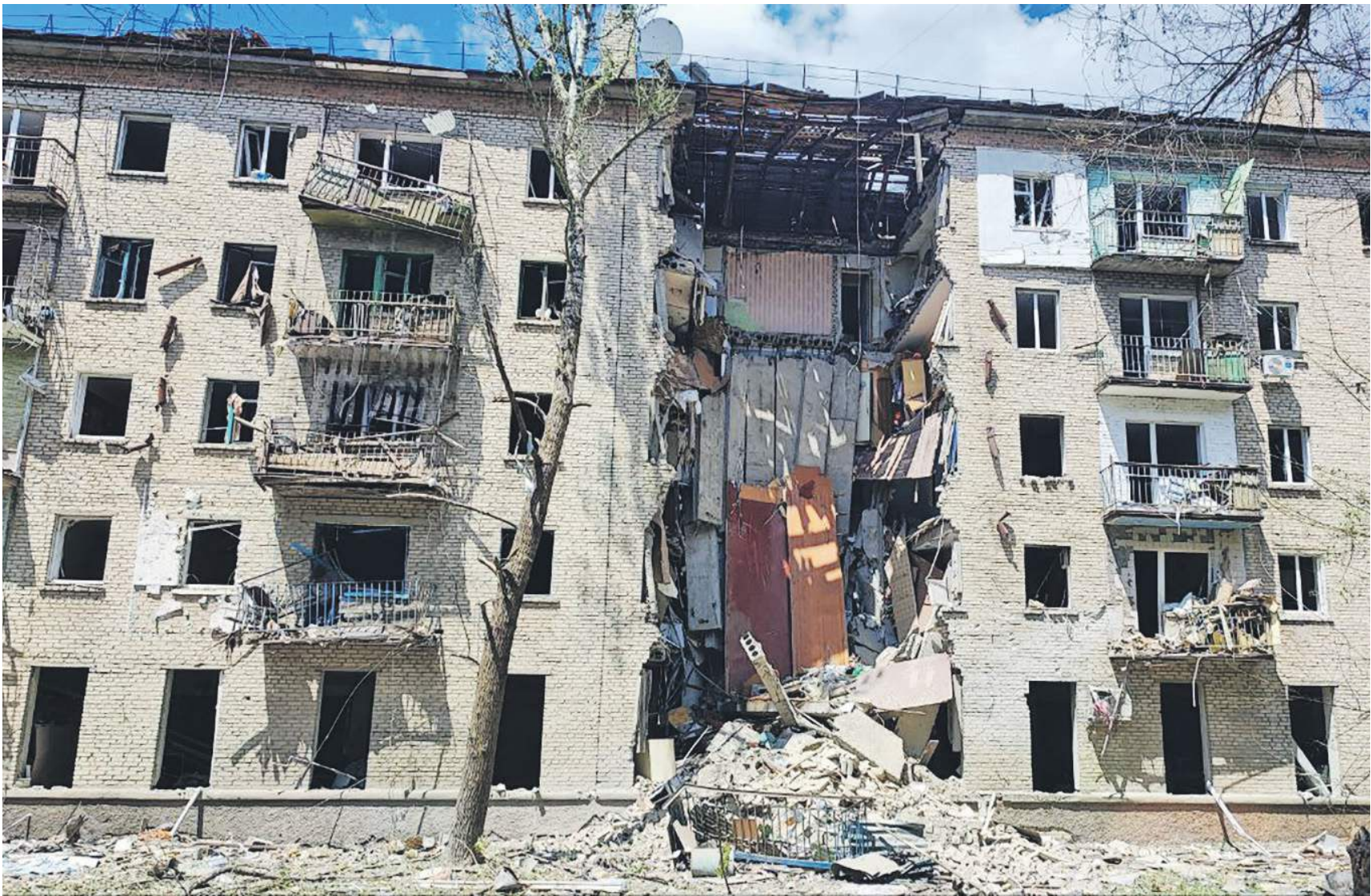
Подъезд дома в Луганске, разрушенный в результате обстрела ВСУ (7 июня)