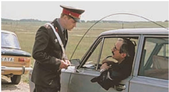
Кадр из фильма «Инспектор ГАИ».

Хотя офицер признал, что на этой дороге иной раз задумаешься, стоит ли останавливать тот или иной автомобиль. Водители разные попадаются. Некоторые начинают вызванивать «хороших друзей». Конечно, для сотрудника это может обернуться словесным выговором, но не больше того. Потому что он