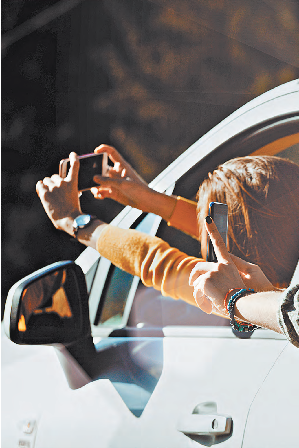
Личка на дороге сможет наказать любой гражданин, просто сняв на смартфон. Главное, чтобы гражданин был зарегистрирован на портале «Госуслуг».

ный инспектор». Затем подтянулась столица, запустив приложение «Помощник Москвы», а потом Московская область с приложением «Добродель». Однако сейчас автоматически штрафы с этих приложений оформлять нельзя. Дело в том, что по определению Верховного суда без оформления протокола выписывать штраф можно только с материалов, полученных с автоматических комплексов фотовидеофиксации нарушений. То есть прибор должен работать без воздействия на него человека. Со смартфоном это невозможно. И хоть такие штрафы продолжают выписывать, они отменяются судами. Еще в 2016 году МВД разработало, а правительство внесло в Госдуму поправки в Кодекс административных правонарушений.