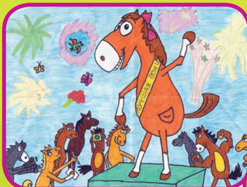
Уругина Юлия из Ниж- него Новгорода