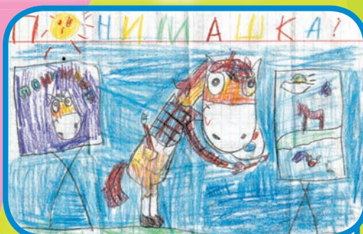
Надир из Омска