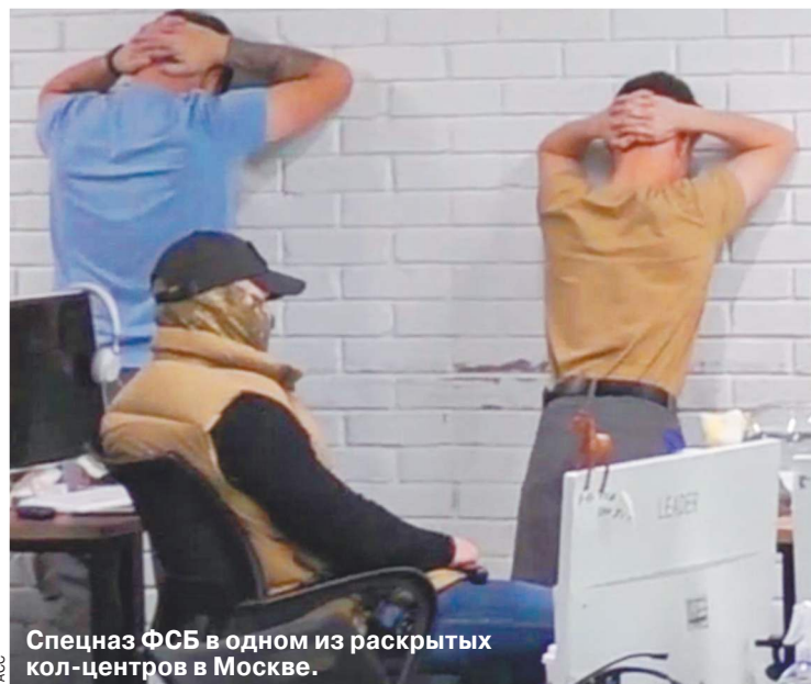
Спецназ ФСБ в одном из раскрытых кол-центров в Москве.