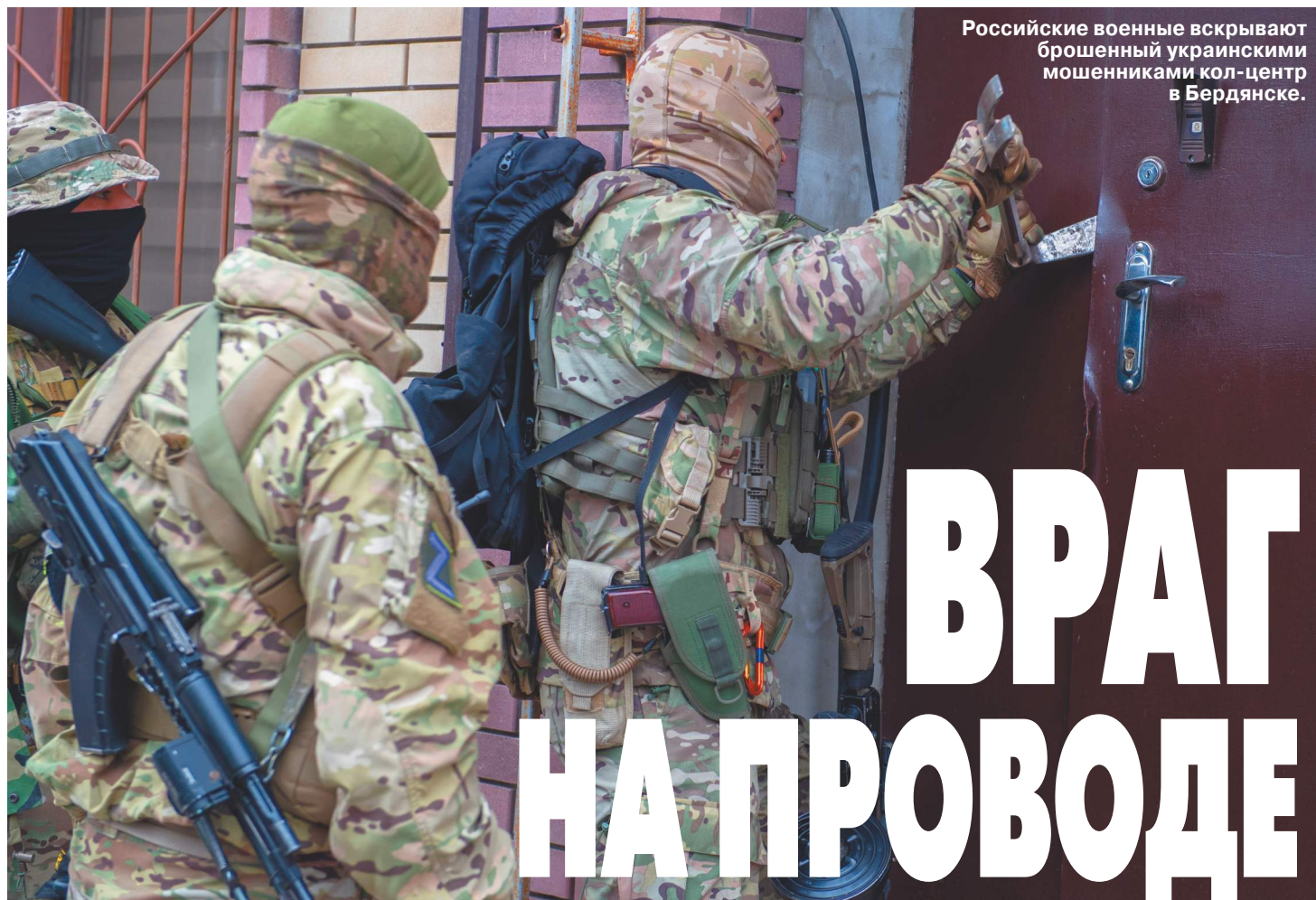
Российские военные вскрывают брошенный украинскими мошениками кол-центр в Бердянске.

Знаменитая баскетболистка отмечает юбилей