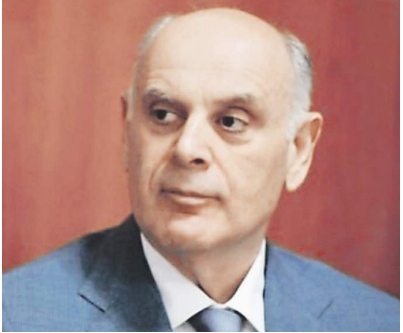
Пресс-служба президента Абхазии

Во время вашей поездки в Москву удалось достичь договорённости о возобновлении сообщения между Россией и Абхазией: пострадала ли экономика республики за время кризиса без российского туриста и насколько?