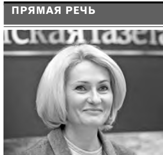
Виктория Абрамченко, вице-премьер правительства РФ:

экологии региона особенно отмечают «Техно» и компанию «Промрекультивация», которые досрочно выполнили обязательства и приступили к формированию новых планов снижения нагрузки на окружающую среду. ●