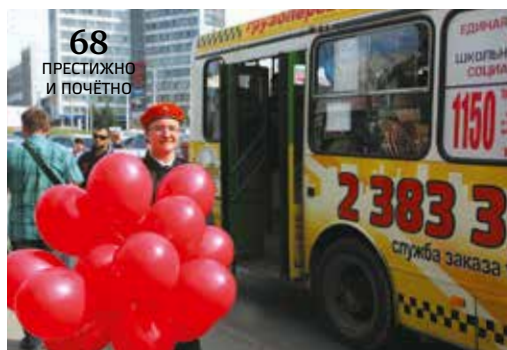
68 ПРЕСТИЖНО И ПОЧЁТНО