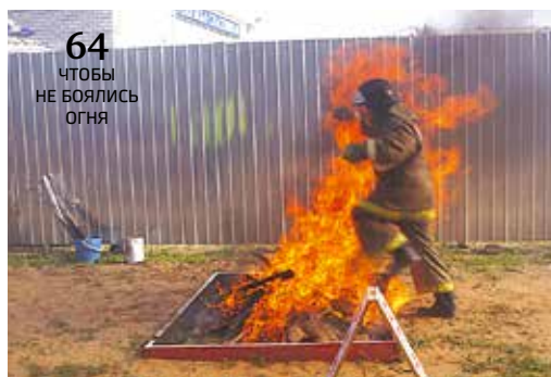
64 ЧТОБЫ НЕ БОЯЛИСЬ ОГНЯ