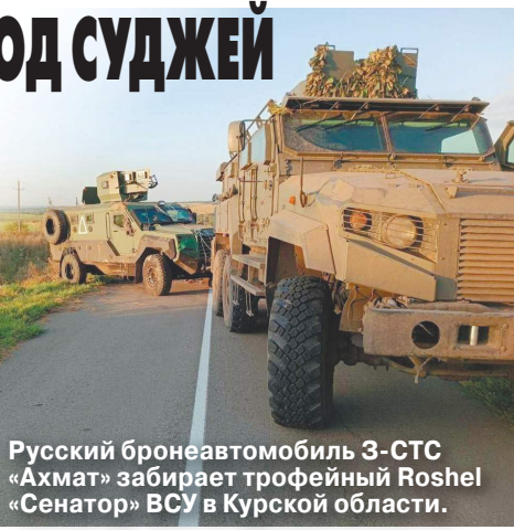
Русский броневладелец 3-СТС «Ахмат» забирает трофейный Roshel «Сенатор» ВСУ в Курской области.