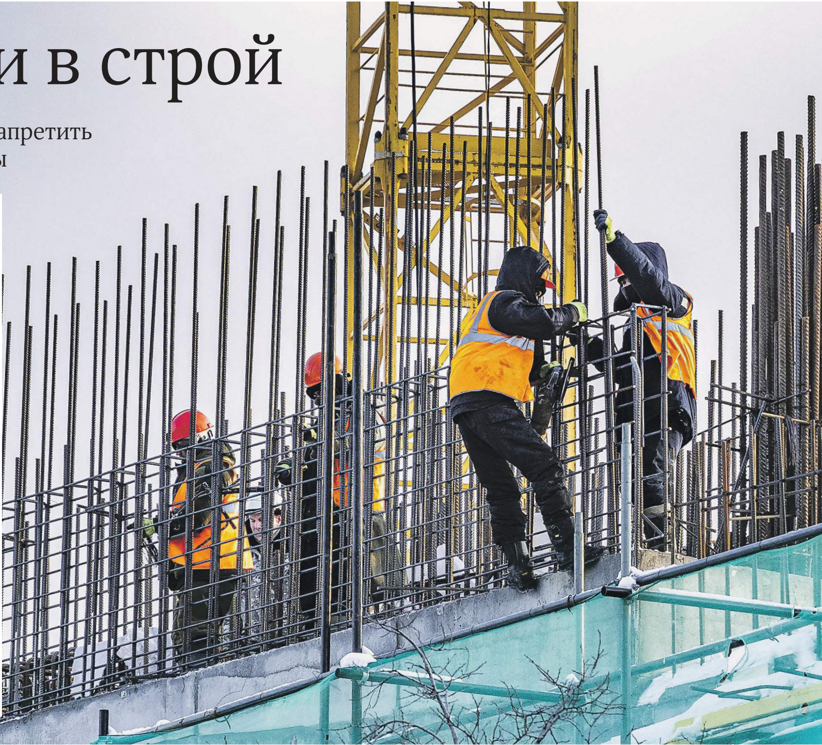
Ксения Козлова / «Известия»