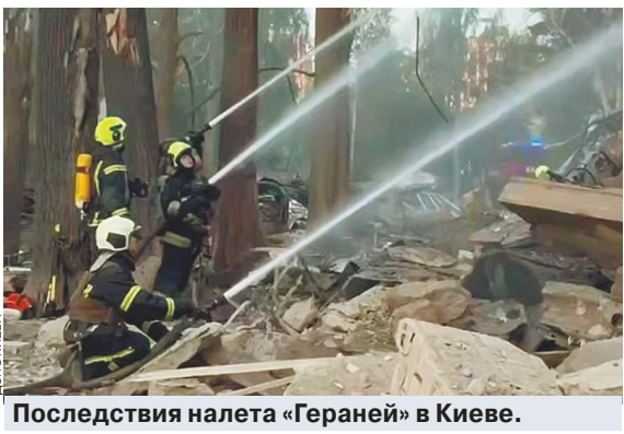
Последствия налета «Гераней» в Киеве.

ВС РФ разгромили в Киеве центры научных разработок