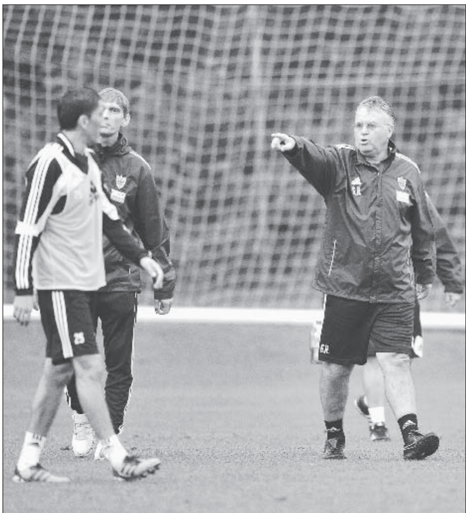
Соборный РФС/ГОВ-младший/ФК «Анжи»

Главный тренер «Анжи» рассказал спецкору «СЭ» о перспективах сотрудничества с махачкалинским клубом, поделился мнением о кандидатах на пост наставника сборной России и оценил выступление нашей команды на Евро-2012