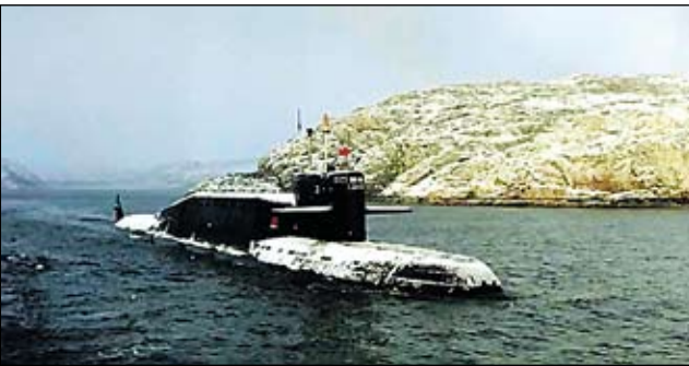
По сообщениям корреспондентов «ВПК», информация от АРМС-ТАСС и Интерфакс-АВН