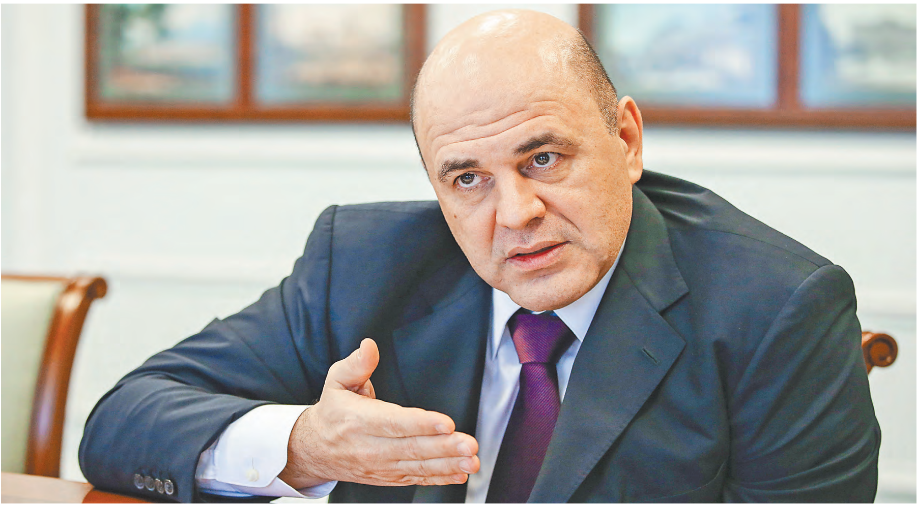
Михаил Мишустин: К выездным проверкам прибегаем, когда абсолютно точно понимаем, что налогоплательщик нарушил все нормы. Тогда в ход идут фискальные меры.

ПОЧЕМУ? Интернет в школы пришел раньше теплого туалета