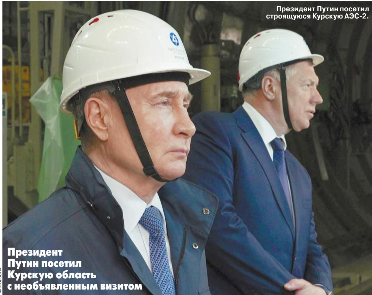
Президент Путин посетил Курскую область с необъявленным визитом