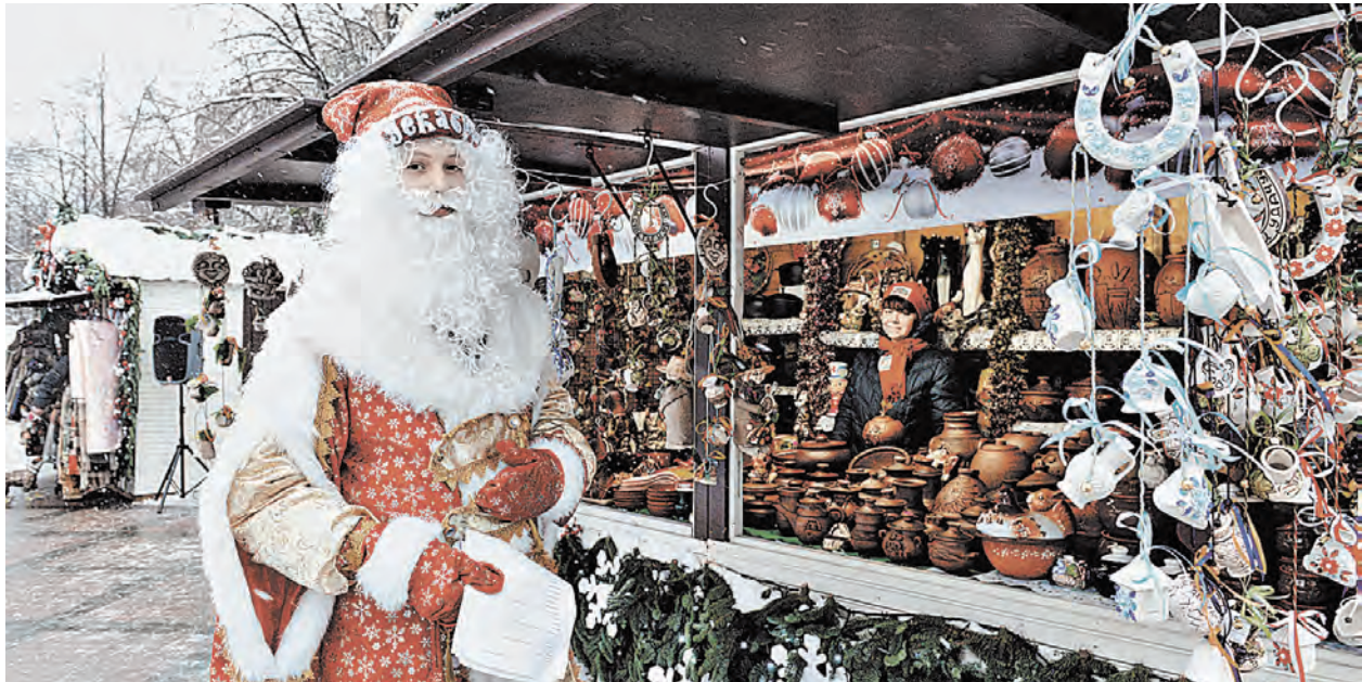
Первым делом Дед Мороз заглянул на белорусскую ярмарку — с большим списком того, что надо уместить в своем чудесном мешке.

Ярмарка работает в будние дни с 12 до 21 часа, а в выходные дни с 11 до 21 часа. Белорусские коробейники будут в российской столице вплоть до 11 января 2015 года.