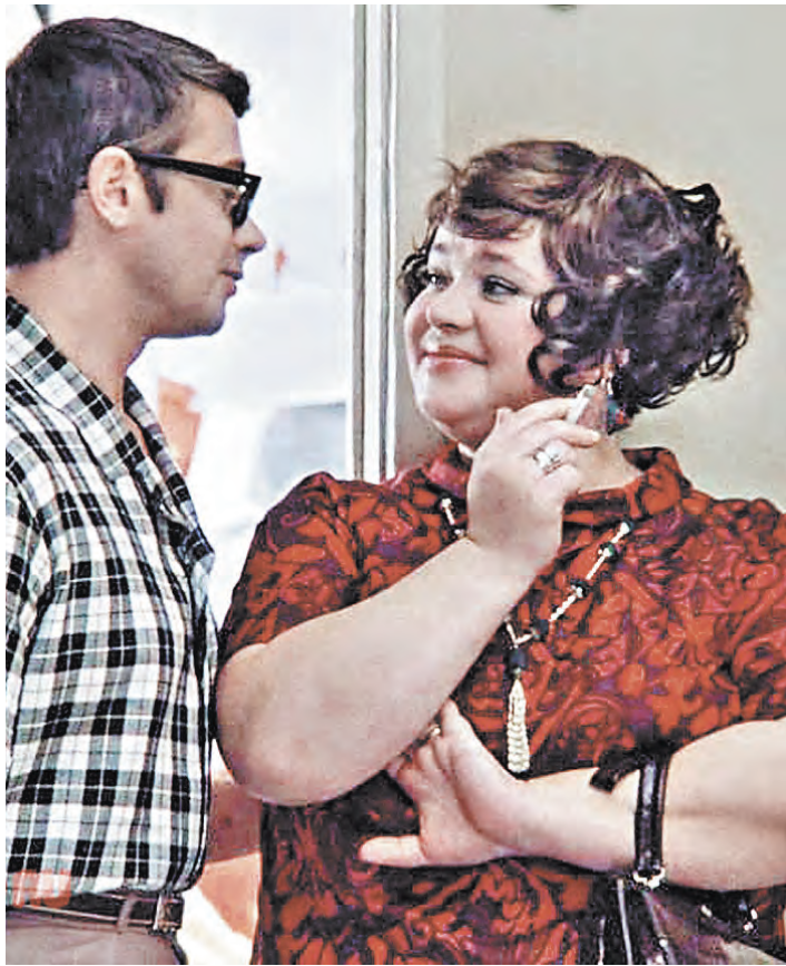
В фильме «Иван Васильевич меняет профессию» Наталья Крачковская сыграла в звездном артистическом ансамбле.

АНОНС / Как готовятся к Новому году татарский Морозко и белорусская Баба-яга?