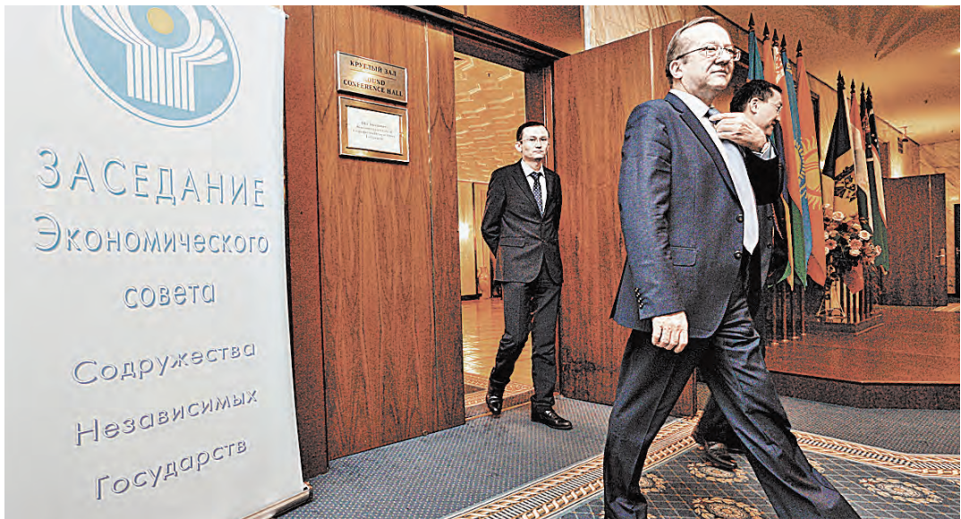
Следующее заседание Экономического совета СНГ планируется провести 13 марта 2015 года в Москве.

СОТРУДНИЧЕСТВО / Белорусы помогут калининградцам подготовиться к ЧМ-2018