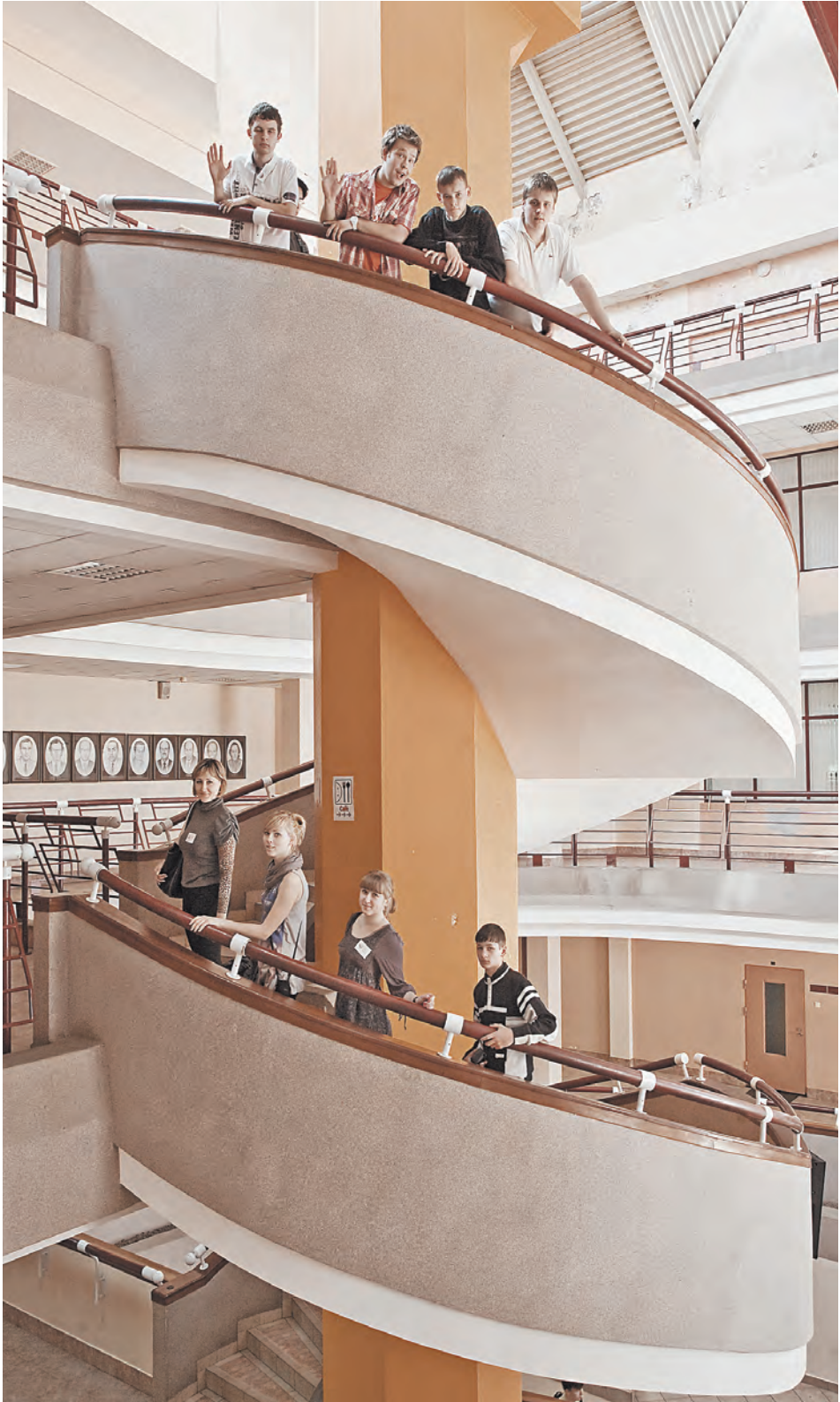
Уже немало сделано на пути построения единого образовательного пространства. Но многие высоты взять еще предстоит.

ФОРУМ / В Москве прошло заседание Экономического совета СНГ