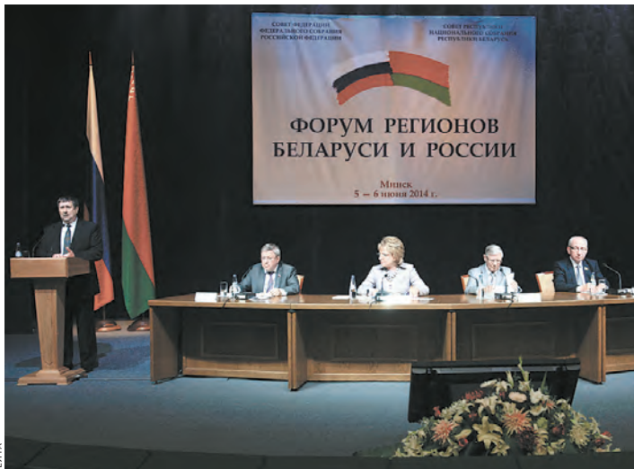
У посланцев регионов всегда найдутся актуальные темы для обсуждения.

404 соглашения о сотрудничестве заключили между собой белорусские и российские регионы. Межрегиональное сотрудничество охватывает более 8000 белорусских и российских предприятий.