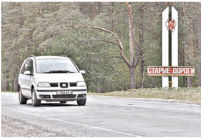
Дороги в Старых Дорогах теперь явно не деревянные.

Дороги, к слову, в судьбе района сыграли роль, можно сказать, сакрентальную. В свое время через эти места был проложен первый мощный путь из Москвы в Европу — Екатеринбургский тракт. А потом близости прошла Ливово-Роменская железная дорога. Местные помещики Дороганывы за свои средства проложили от нее ветку к нынешним Старым Дорогам.