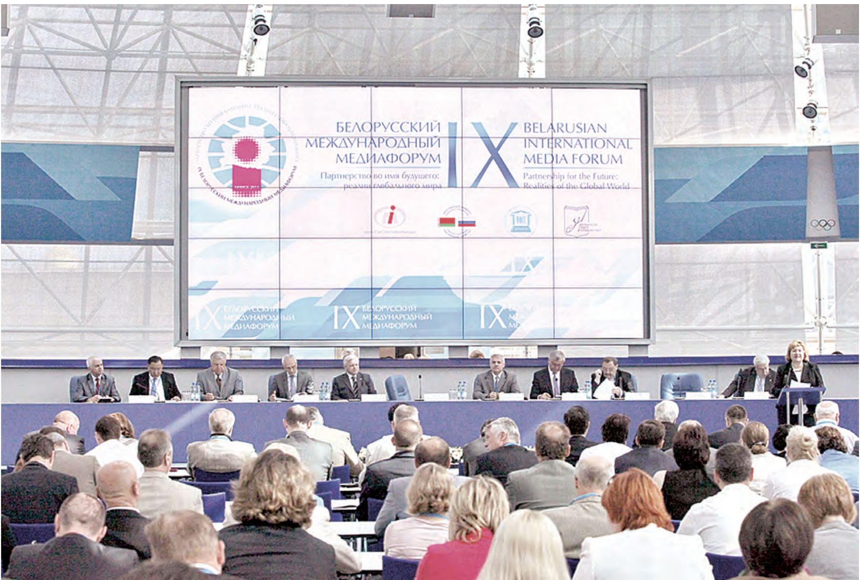
Пленарные заседания форума проходят в зале Олимпийской славы Национального олимпийского комитета Беларуси.