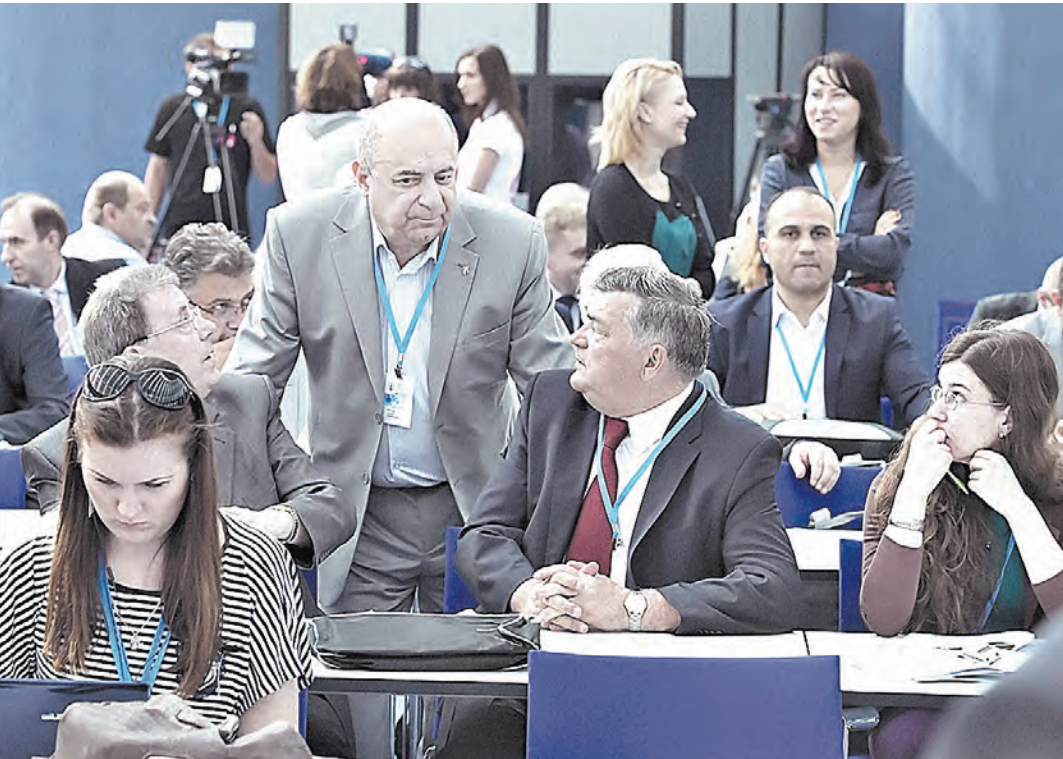
Госсекретарь Союзного государства Григорий Рапота (на правом снимке): Если выстроить линейку национальных приоритетов, то самое важное — внутреннее развитие и внутренняя стабильность.