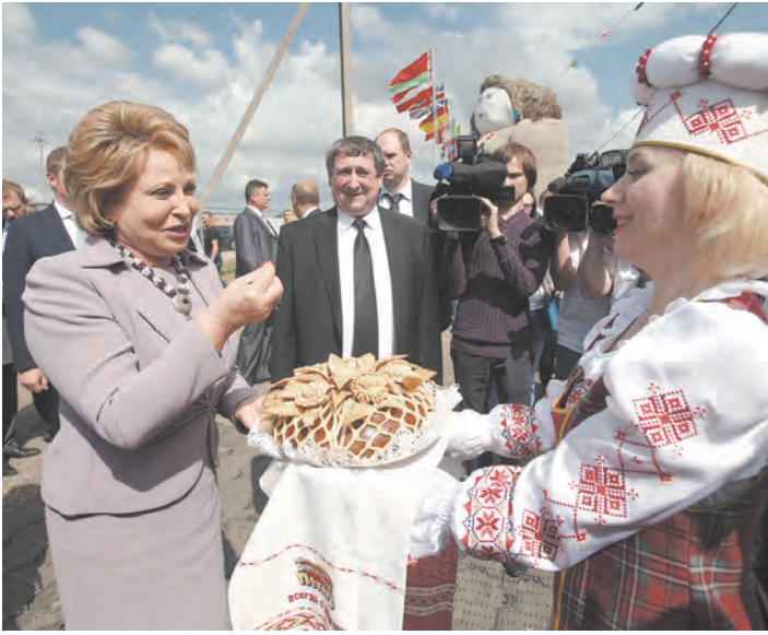
Российскую делегацию на Первом форуме регионов возглавляла председатель Совета Федерации РФ Валентина Матвиенко.