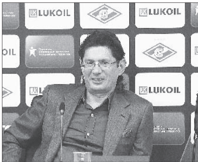
Вчера, Тушино. Владелец «Спартак» Леонид ФЕДУН.

Вчера владелец «Спартак» сделал ряд заявлений, самое главное из которых - о будущем в команде главного тренера. Вопрос о продлении контракта с Дмитрием Аленичевым будет решен 31 мая на совете директоров.