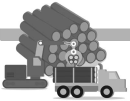
ИНФОГРАФИКА: РГ / ЛЕСНОЙ СТРОИТЕЛЬНЫЙ АНАЛИЗ

• Этикеточная продукция — 30,6 миллиарда единиц