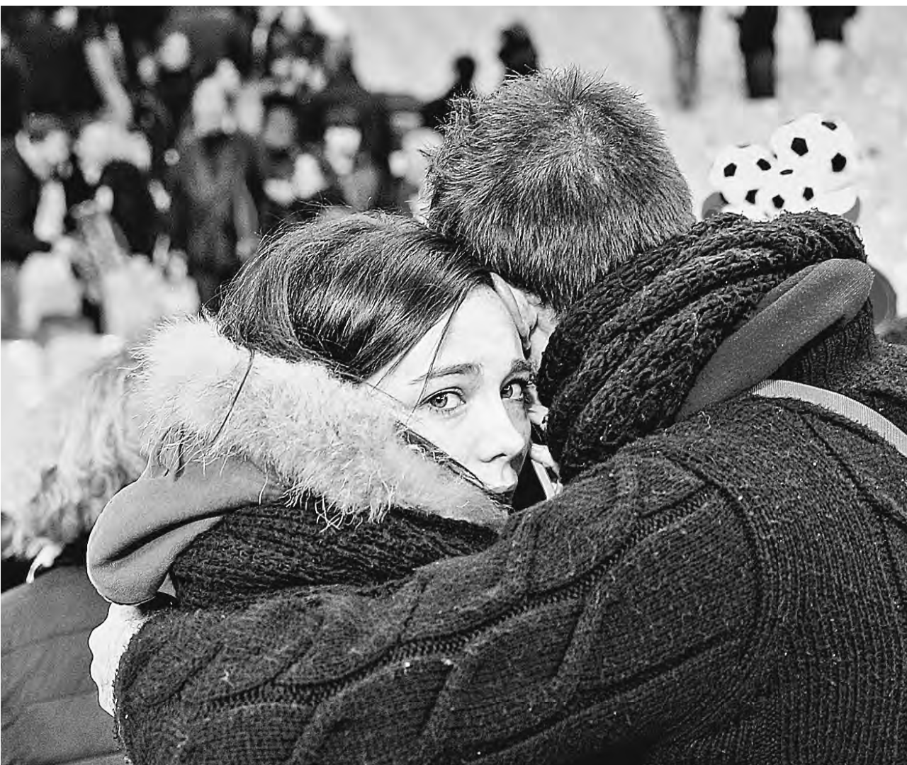
«Stade de France»: взгляд страха.

Вячеслав Прокофьев, «Российская газета», Париж