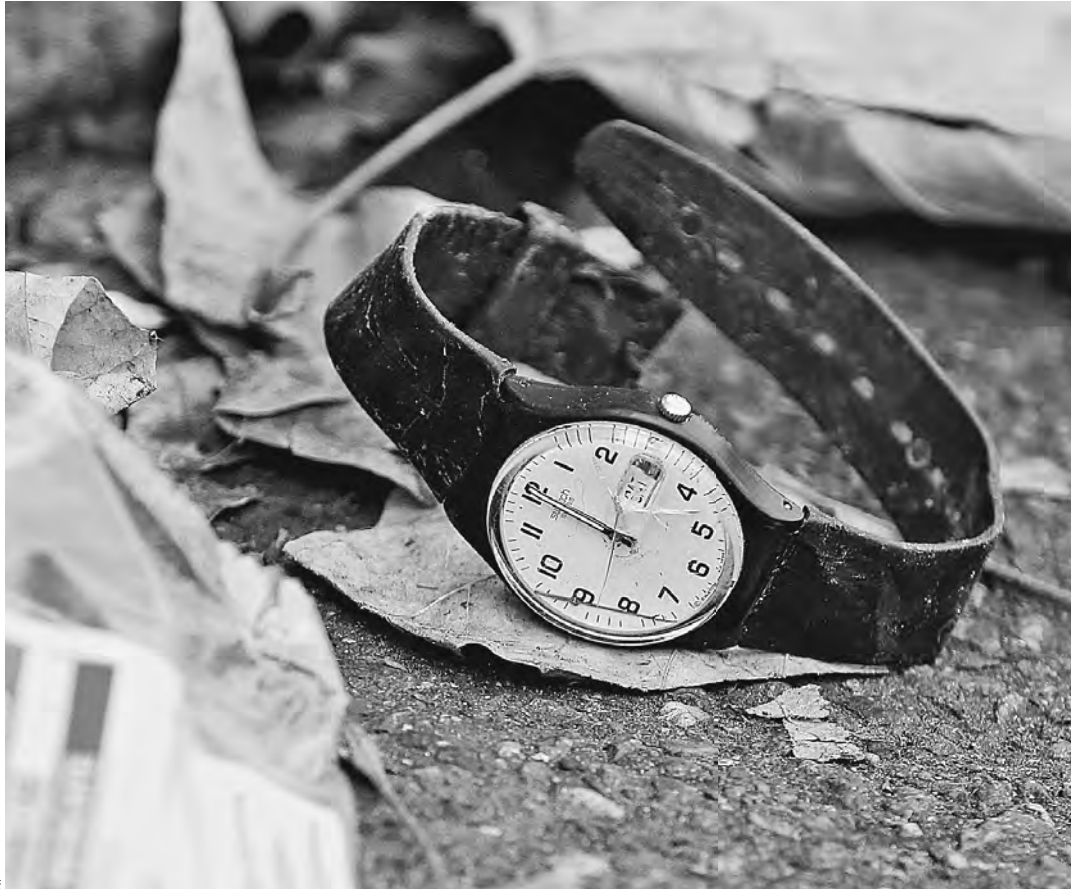
Эти часы были найдены на месте трагедии у концертного зала «Батаклан».

G20 Владимир Путин: Справиться с террористической угрозой можно, только объединив усилия всего мира Фронт двадцати