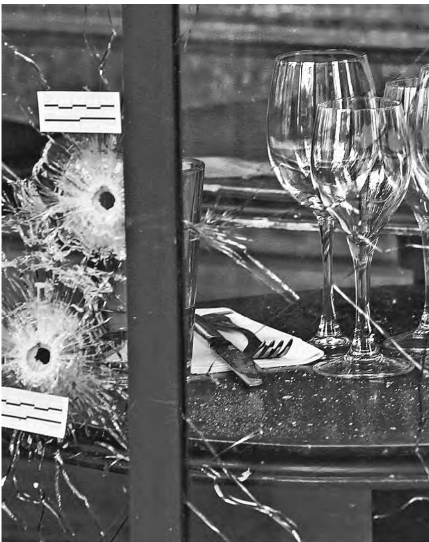
Следы от пуль, попавших в окно ресторана во время смертельной атаки террористов.