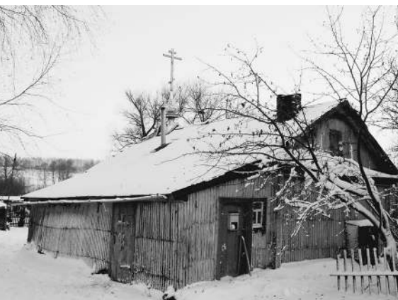
В селе Никольское — ни души