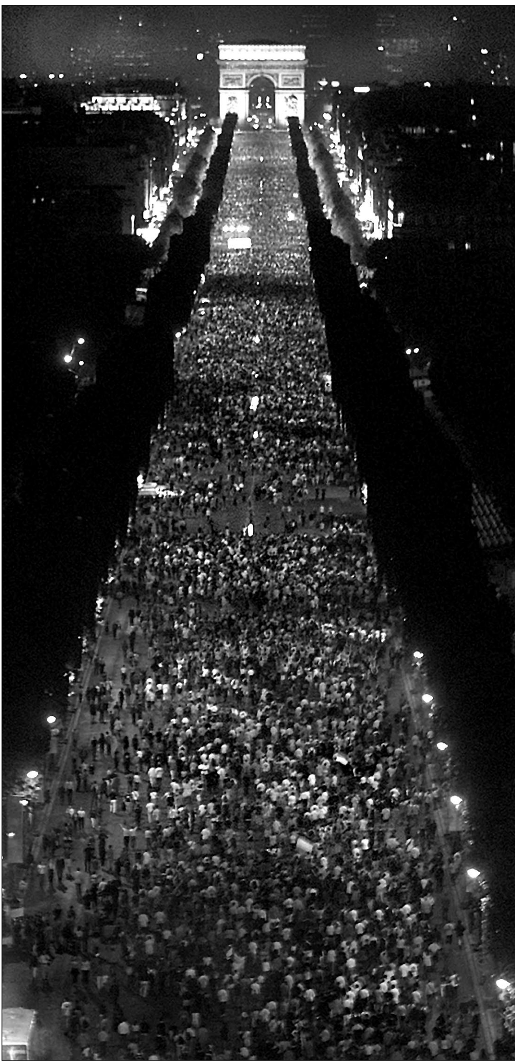
Вчера, Париж. Франция снова счастлива футболом. Ликует полумиллионная толпа на Елисейских полях.

В воскресенье чемпионами Европы стали французы, наши недавние соперники по 4-й отборочной группе. 2 июля 2000 года Франция победила в Роттердаме Италию - 2:1, 5 июня 1999 года Россия обыграла в Сен-Дени Францию - 3:2. Конечно, между этими матчами множество различий, сравнивать их трудно, может быть, даже нелепо. Но футбол - игра, и мы решили пофантазировать. Просто помечать: