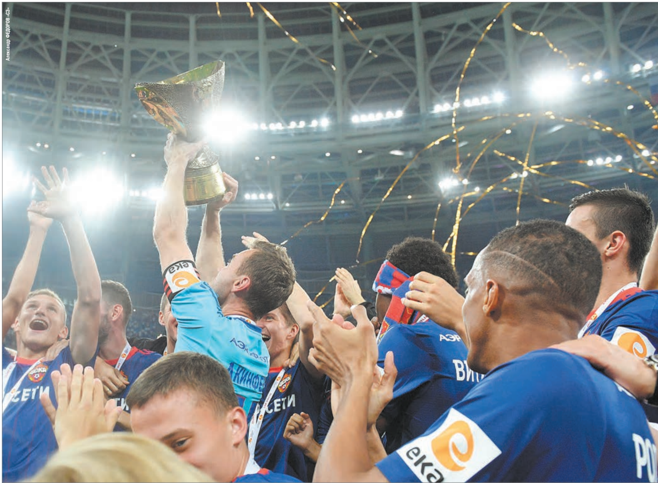
Вчера. Нижний Новгород. «Локомотив» - ЦСКА - 0:1. Армейцы - обладатели Суперкубка России!

После феерического чемпионата мира выставочный матч за Суперкубок не впечатлил