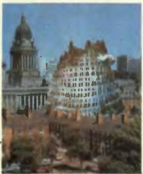
Обложка А. Обросковой и Э. Бажилина

Вавилонская башня так и не была построена, потому что люди не смогли договориться друг с другом.