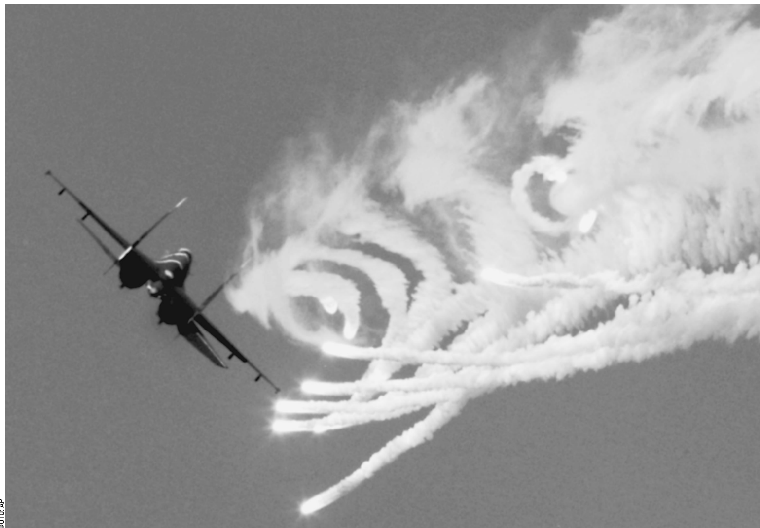
ФИГУРЫ ВЫСШЕГО ПИЛОТАЖА в исполнении «Русских витязей» и «Стрижей» удивили даже видавшего виды ПРЕЗИДЕНТА

«Открытие очередного международного авиакосмического салона, организатором которого в течение 15 лет является Россия, — событие для нас в высшей степени знаменательное. Это не только выставка и аэрошоу мирового класса. «МАКС» стал главным авиационным праздником нашей страны», — заявил вчера Владимир Путин. Восьмой авиакосмический салон «МАКС-2007» уже в первый же день принес сенсацию — «Рособоронэкспорт» подписал первый контракт с Индонезией на поставку шести многоцелевых боевых самолетов: три Су-27 и три Су-30. По мнению экспертов, общая сумма контракта составляет $330 млн.