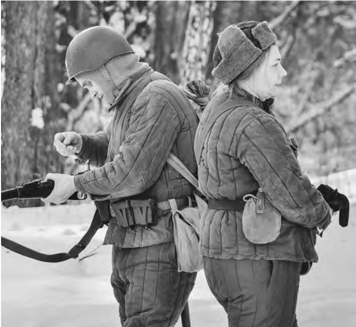
В лесу уличные бои не изобразишь, поэтому возникла идея показать «Малый Сталинград».

В Сталинградской битве погибло около 150 тысяч сибиряков. Общие потери обеих сторон оцениваются в 2,5 миллиона человек.