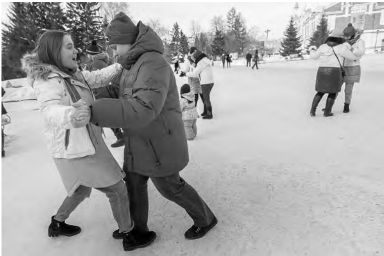
В Первомайском сквере Новосибирска в день 75-летнего юбилея победы в Сталинградской битве прошел флешмоб, на котором танцевали под знаменитую песню военных лет «Случайный вальс».