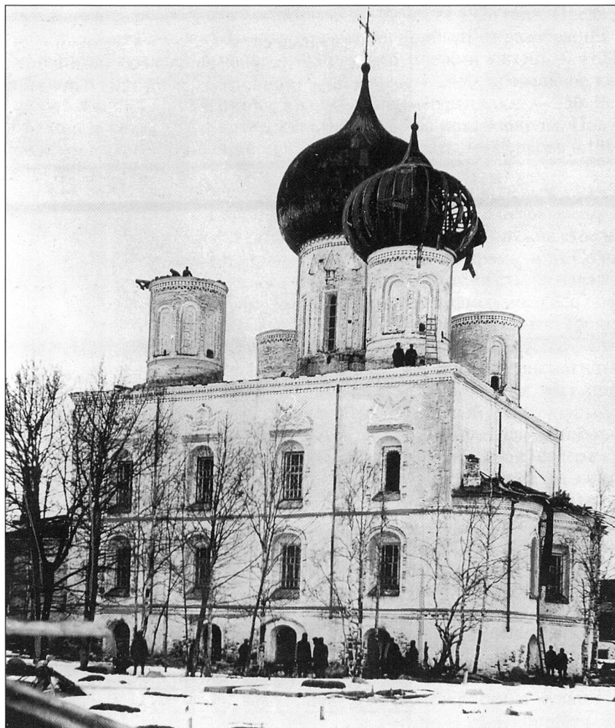
Ил. 3. Разрушение Михайло-Архангельского собора. АОКМ. № 693