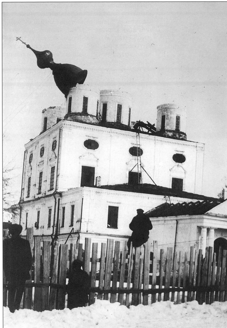
Ил. 1. Разрушение Свято-Троицкого собора. Фото Соболева. 1928 г. ГААО. 3—336. Публикуется впервые