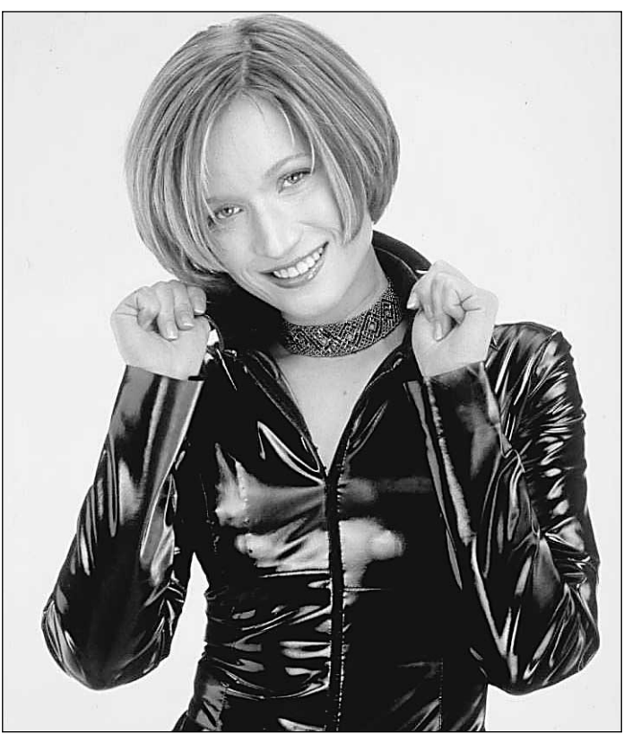
Мария КИСЕЛЕВА, ведущая телепрограммы «Слабое звено»: