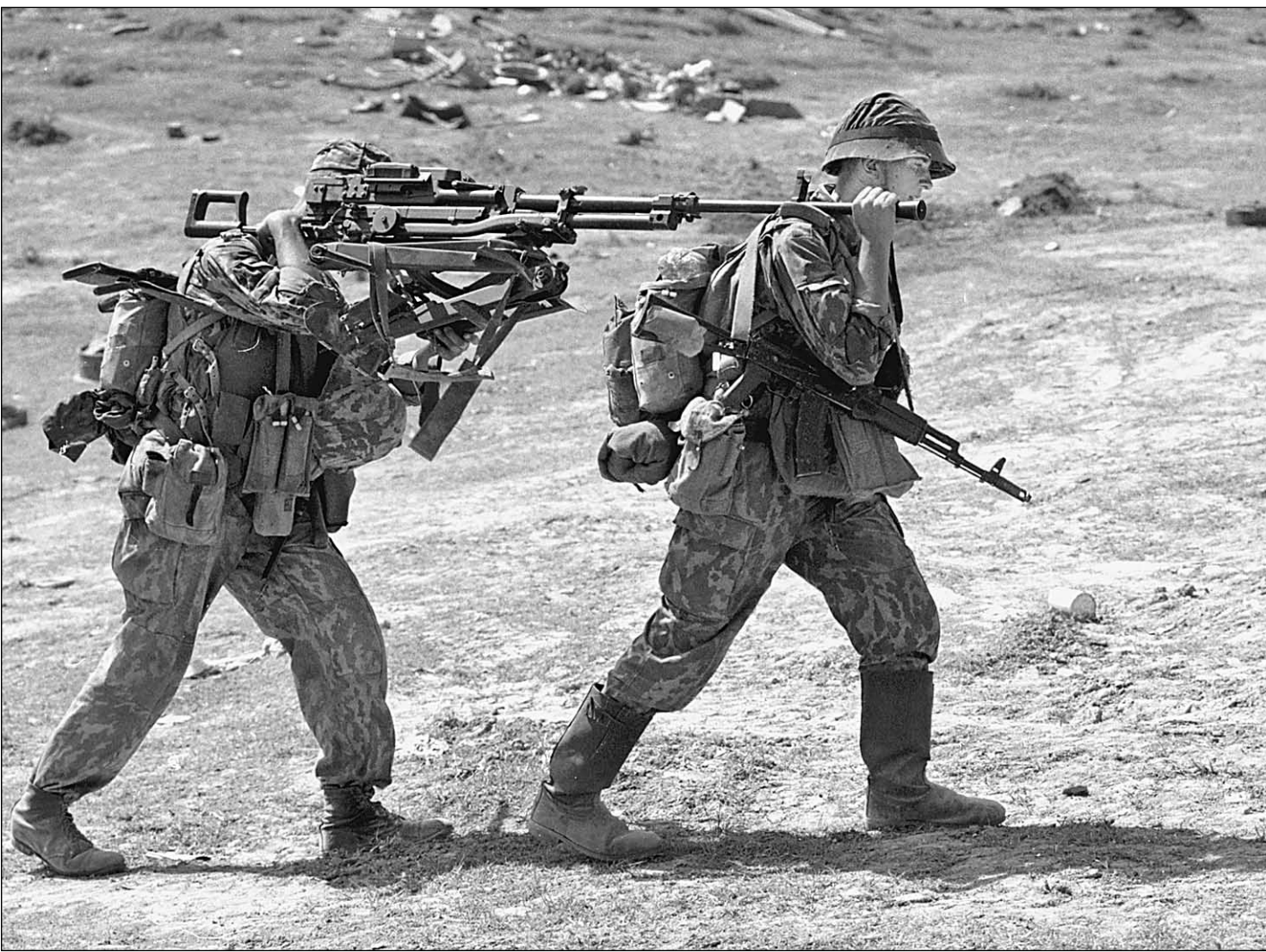
Псковская дивизия ВДВ: профессионалы в непрофессиональной армии

— Вылет самолета задерживается по погодным условиям Пскова, — заявил в девять утра диспетчер военного аэродрома Чкаловский лидер правых, депутату Госдумы Борису Немцову, решившему лично посмотреть, как