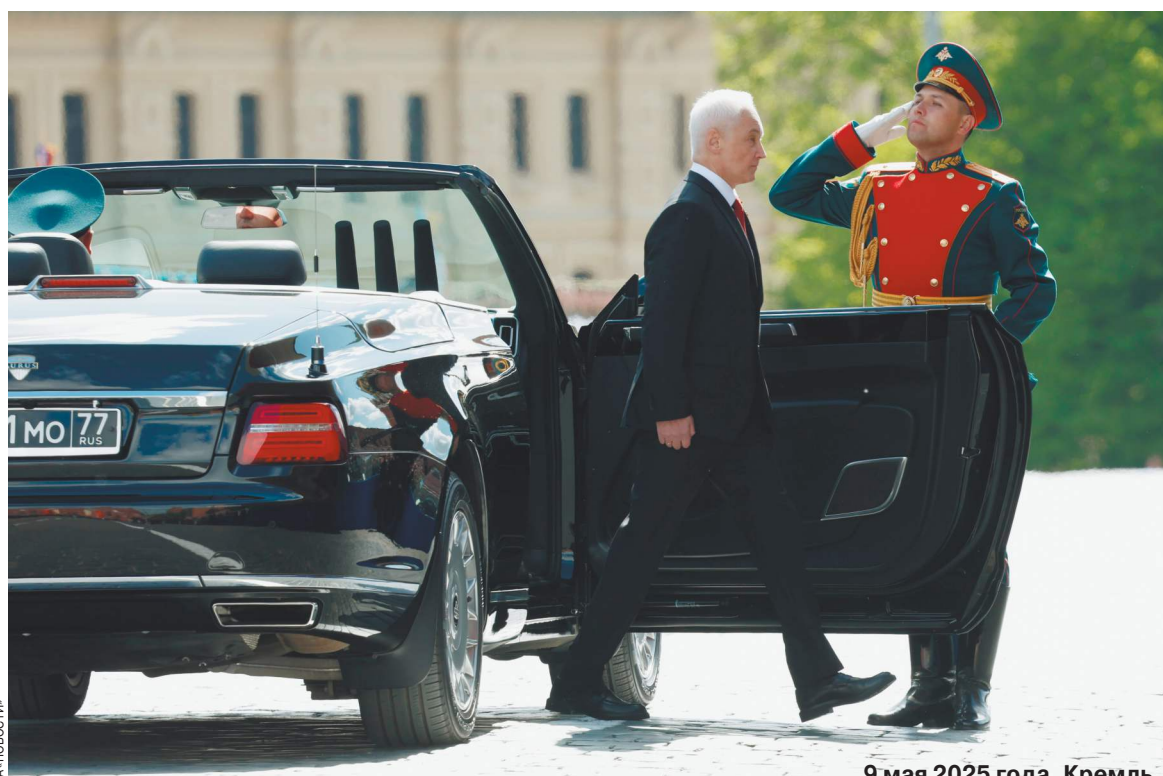
9 мая 2025 года, Кремль.