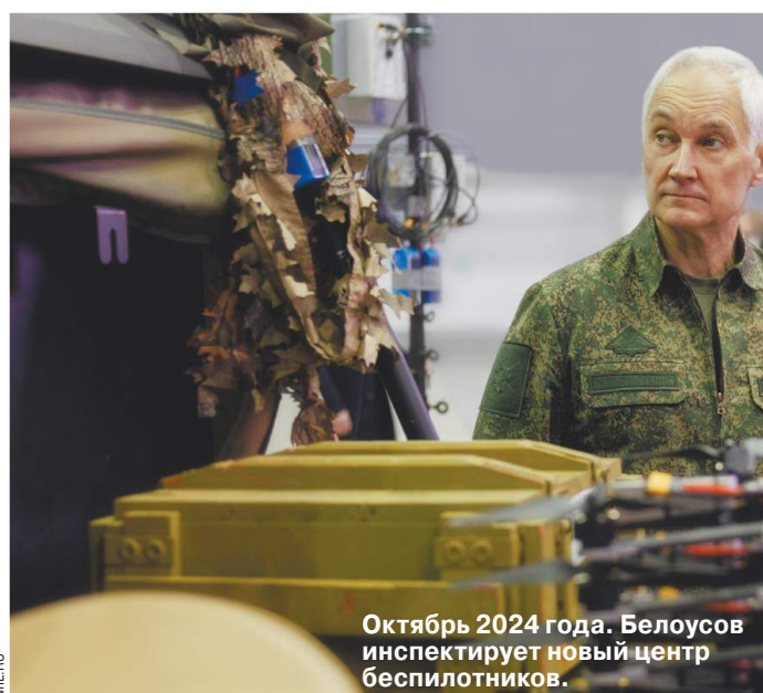
Октябрь 2024 года. Белоусов инспектирует новый центр беспилотников.