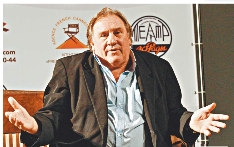
ЖЕРАР ДЕПАРДЬЕ ПОЛУЧИЛ СРОК Французского актёра осудили за сексуальные преступления