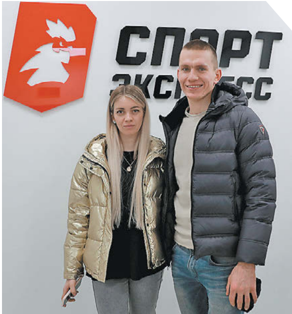
Александр Федоров «СЗ». Снято на Canon