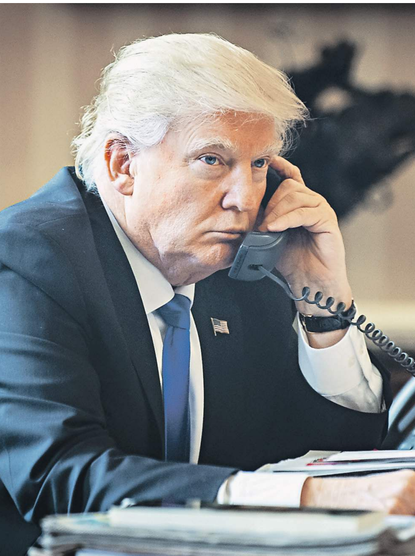
В ходе беседы лидеры двух стран договорились поддерживать регулярные личные контакты

«В ходе беседы с обеих сторон был продемонстрирован настрой на активную совместную работу по стабилизации и развитию российско-американского взаимодействия на конструктивной, равноправной и взаимовыгодной основе. Обстоятельно обсуждены актуальные международные проблемы, включая борьбу с терроризмом, положение дел на Ближнем Востоке, арабско-израильский конфликт, сферу стратегической стабильности и нераспространения, ситуацию вокруг иранской ядерной программы и Корейского полуострова. Затронуты также основные аспекты кризиса на