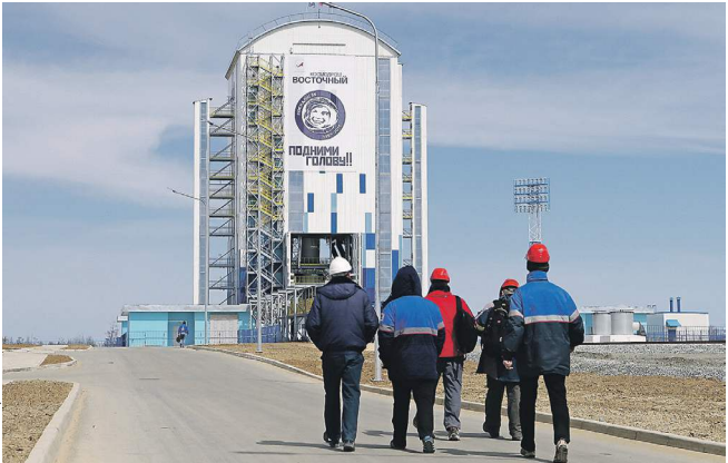
Конкурс на строительство второй очереди «Восточного» «Роскосмос» планирует объявить осенью 2017 года

ISSN 0233-4356 9 770233 435501 1 0 1 0 5