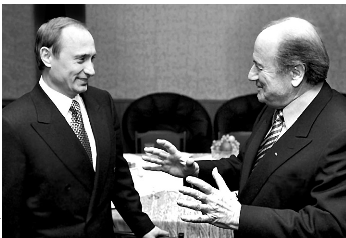
Вчера, Москва, Кремль. Исполняющий обязанности президента России Владимир ПУТИН и президент ФИФА Зепп БЛАТТЕР.

- ФИФА намерена поддерживать как национальные ассоциации, так и клубные команды. В частности, мы должны защищать их интересы в связи с попытками создания различных футбольных лиг вне существующих конфедераций. Недавно мы пришли к согласию с президентом УЕФА Леннартом Юханссоном относительно недопустимости подобных действий. Клубы, нарушившие наши законы, будут исключены из соответствующих конфедераций. В то же самое время мы будем стараться помогать клубам ре-