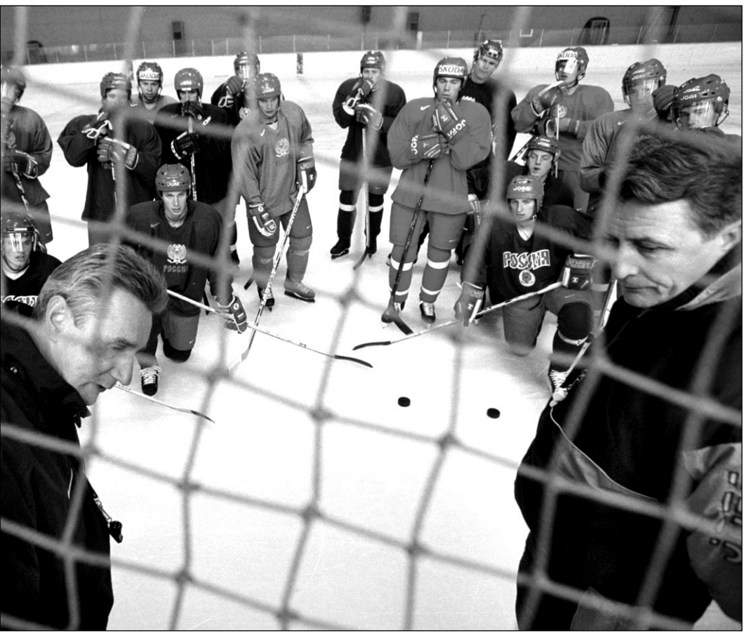
Вчера. Новогорск. Заключительная тренировка российской сборной перед первым турниром нынешнего сезона в Чехии.

В заявку на турнир должно быть включено 23 хоккеиста. «Лишних» вратаря и защитника тренеры определят перед отъездом в аэропорт.