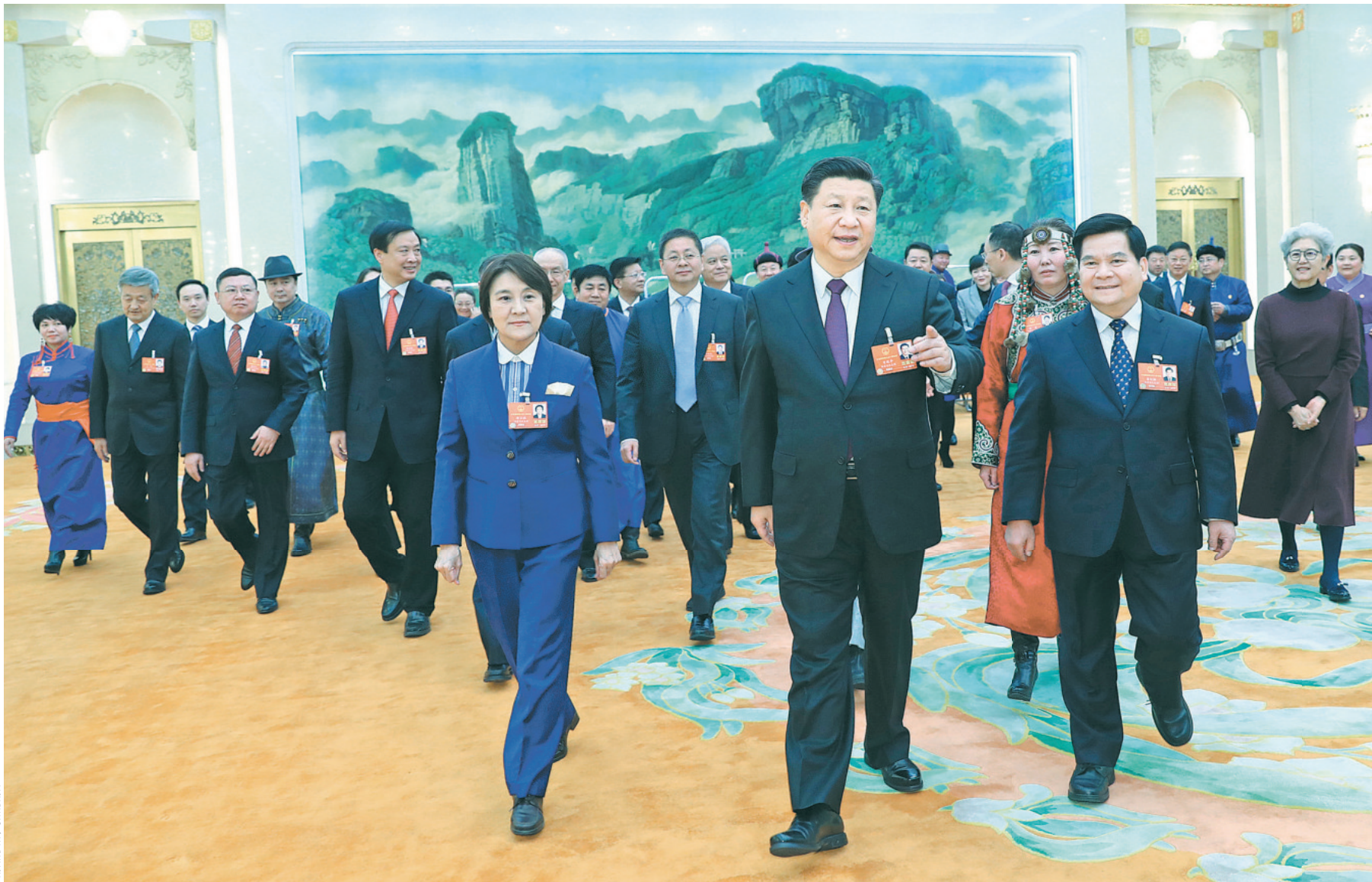
Лидер КНР Си Цзиньпин присоединяется к депутатам от автономного района Внутренняя Монголия для обсуждения доклада о работе правительства в Доме народных собраний 5 марта.

Для достижения качественно-го роста Ли Кэцян обозначил девять ключевых предложений: 1) углублять структурные реформы в сфере предложения;