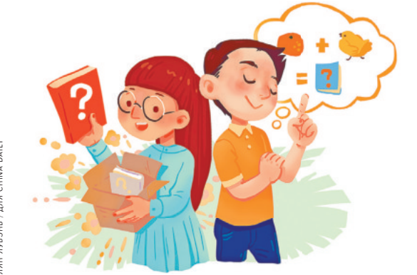
Такой выбор книг похож на свидание вслепую: вы ничего не знаете о человеке, пока не познакомитесь с ним лично.