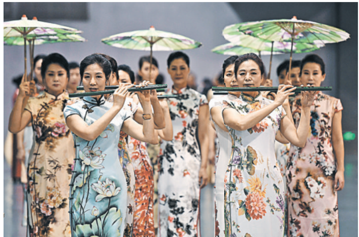
Модели в возрасте от 60 и старше демонстрируют одежду на подиуме.

одеждой, косметикой и легкими закусками. Средний возраст — старше 60 лет, на лице каждого сияет улыбка. И повод для радости есть — все они одержали победу в первом раунде конкурса моделей среди пожилых жителей Пекина и собрались в музее, где должен был пройти финал.