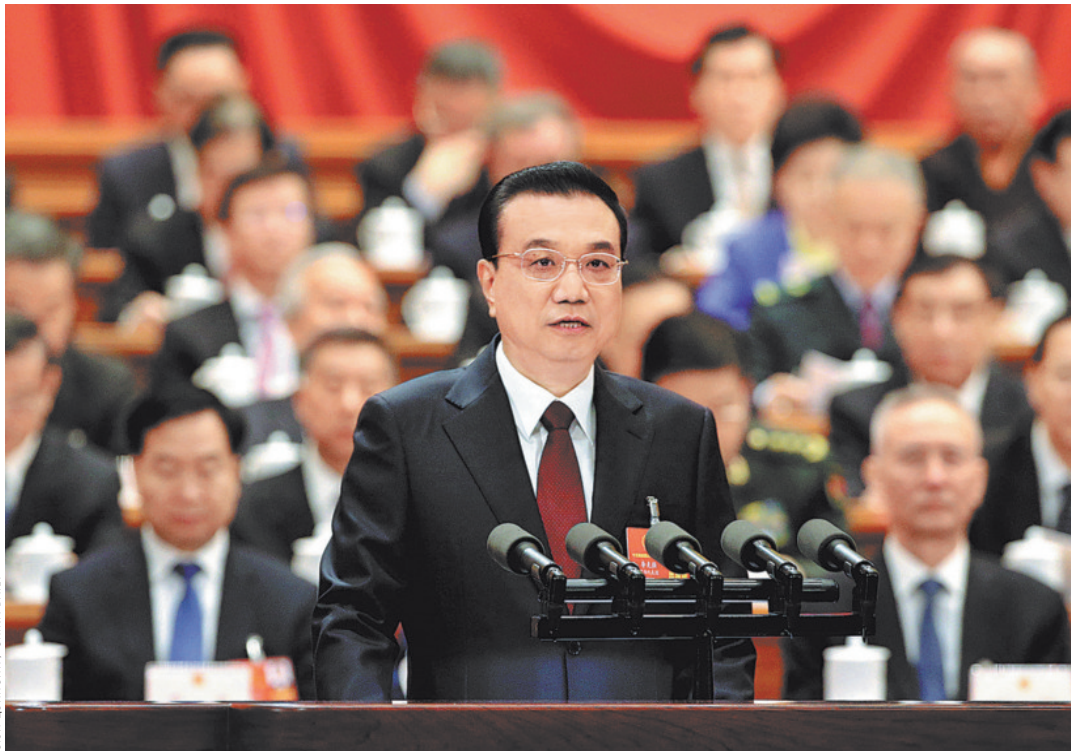
Премьер-министр КНР Ли Кэцян выступил с докладом о работе правительства на открытии первой сессии 13-го Всекитайского собрания народных представителей в Доме народных собраний в Пекине 5 марта.

2) форсировать создание государства инновационного типа; 3) углублять реформы в фундаментальных и ключевых областях; 4) настойчиво и добросовестно решать «три сложнейшие задачи» (снизить финансовые риски, справиться с бедностью и загрязнением внешней среды); 5) активно осуществлять стратегию подъема села; 6) по-деловому стимулировать реализацию стратегии согласованного развития регионов; 7) активно на-