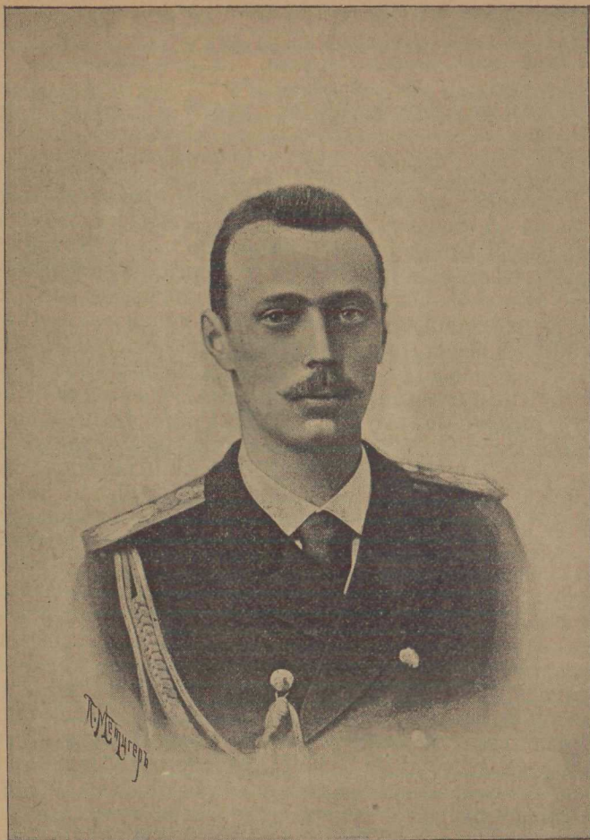
† Е. И. В. Наслѣдникъ Цесаревичъ и Великій Князь Георгій Александровичъ.