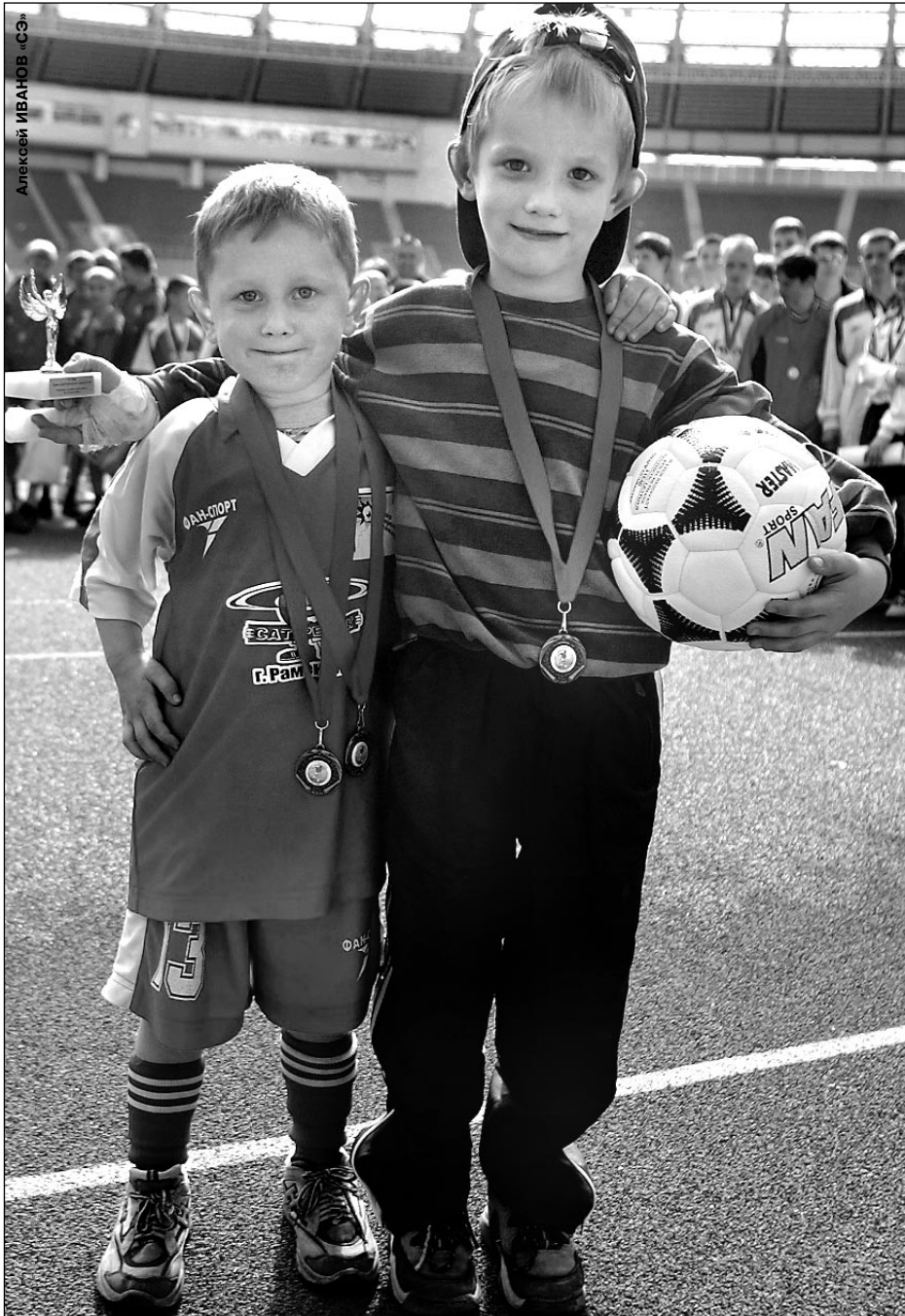
Вчера. Москва. Лужники. Финал Турнира дворовых команд «СЭ». У этих мальчишек свой «Олд Траффорд» еще впереди.

Полностью таблица коэффициентов УЕФА, итоги Лиги чемпионов-2002/03 - в «СЭФ» стр. 2 - 3