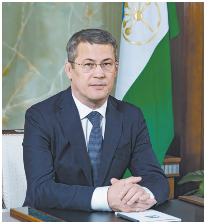
Радий Хабиров: В наших планах ничего не изменилось.

Говоря об экономике, Радий Хабиров отметил, что республике нужен инвестиционный прорыв. В этом году Башкортостан