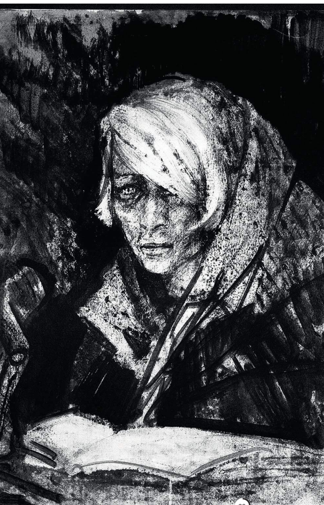
Е. МАРТИЛА. «ГОВОРИТ ЛЕНИНГРАД». ЛИТОГРАФИЯ