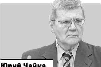
Юрий Чайка, генеральный прокурор РФ