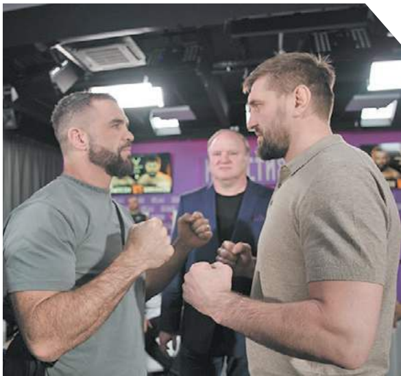
Сергей Ланцов «Известия»