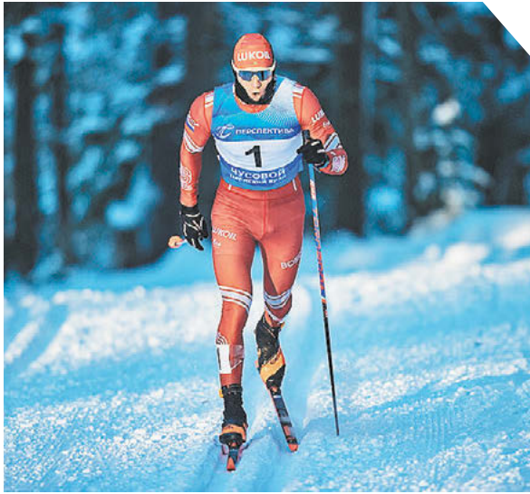
Роман Курчинин РИА «Новости»