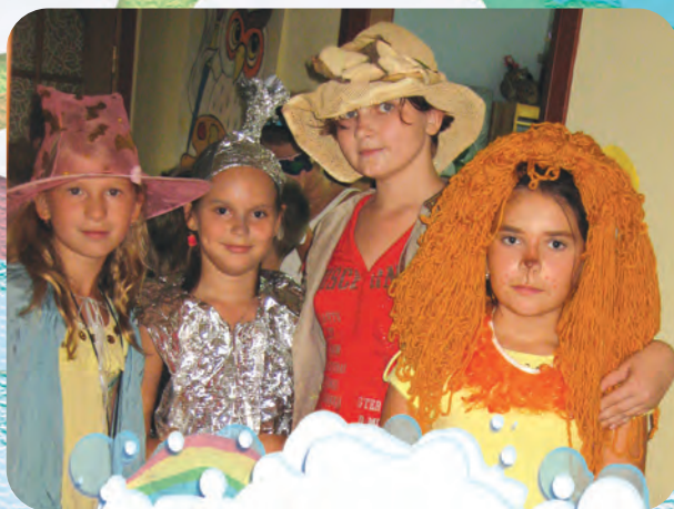
День рождения в Волшебной стране