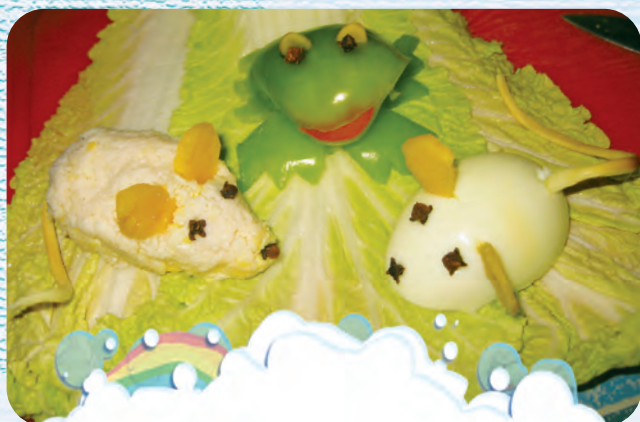
Угощение от Гингеми