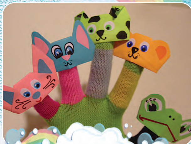
Театр для пальчиков за полчаса