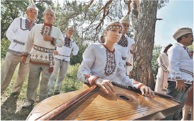
Марийцев порой называют язычниками, на что они обижаются, говоря, что это в корне неверно.

О верховном карте мы были слышаны еще до поездки. В своей республике он личность легендарная. У него большая семья — шесть детей и столько же внуков. В свои 72 года он очень бодр. Говорят, что жрец купа-