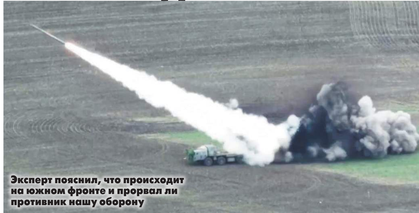
Эксперт пояснил, что происходит на южном фронте и прорвал ли противник нашу оборону

Слухи о прорыве первой линии нашей обороны все чаще муссируются украинской стороной. Так, командующий украинскими войсками на южном направлении генерал Александр Тарнавский в интервью британской газете заявил, что ВСУ якобы уже находятся между первой и второй линиями