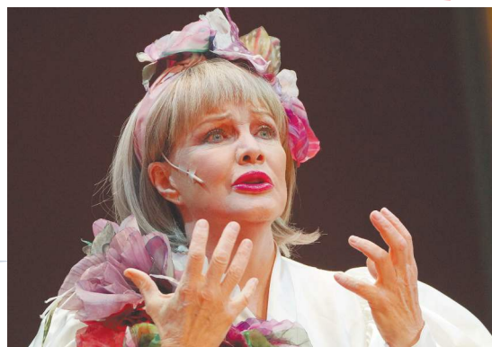
ЕЛЕНА ПРОКЛОВА НЕ СКРЫВАЕТ СВОИ 70 ЛЕТ «Не собираюсь оставлять актерскую карьеру»