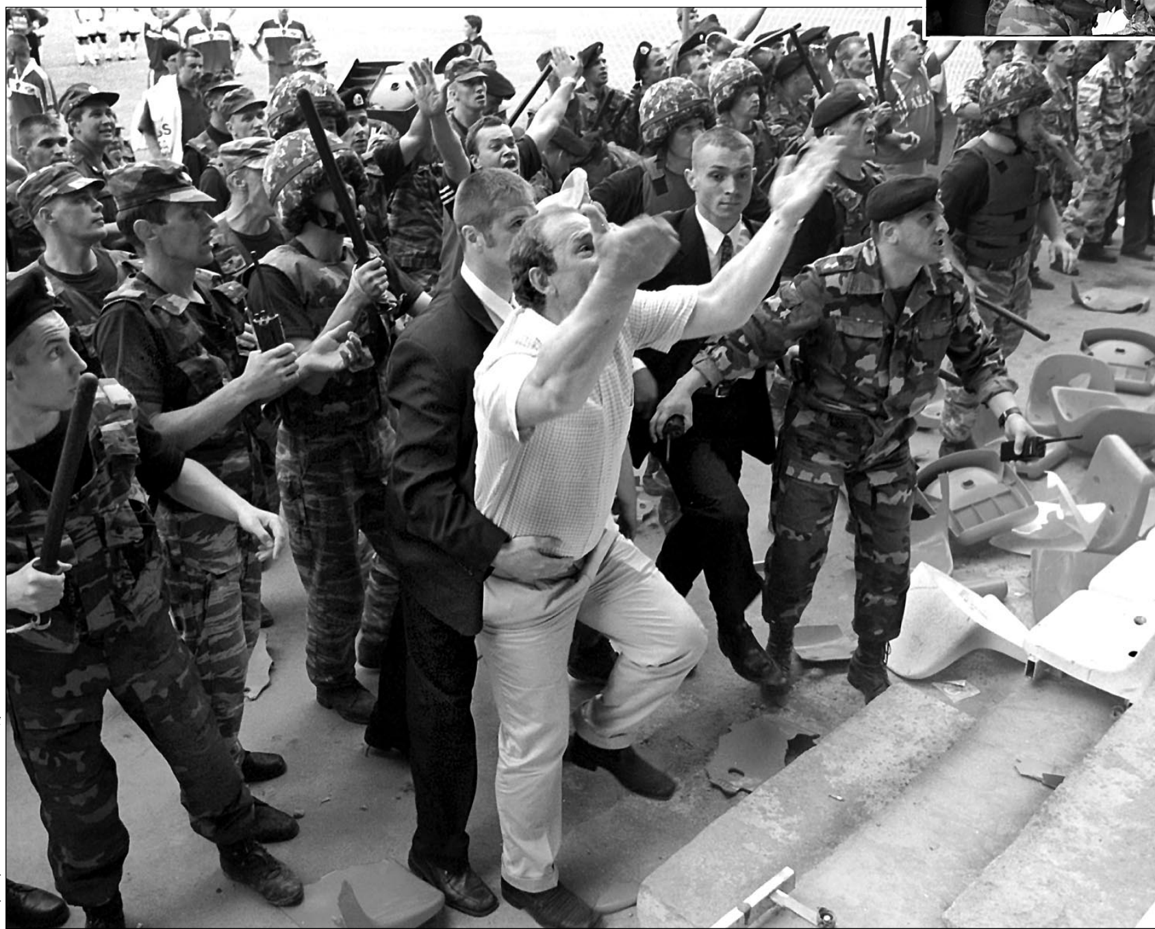
Суббота. Раменское. «Сатурн» - «Спартак» - 0:3. В середине первого тайма матч был остановлен на 15 минут, в течение которых Олег РОМАНЦЕВ пытался образумить разбушевавшихся спартаковских фанатов.

Такого в российской футбольной истории еще не бывало. Случалось, фанаты выясняли отношения за пределами стадиона. В субботу невиданных масштабов беспорядки произошли в Раменском на самой арене, да еще и во время игры. Впервые официальный матч был прерван на 15 минут - с тем чтобы уговорить разбушевавшихся фанатов.