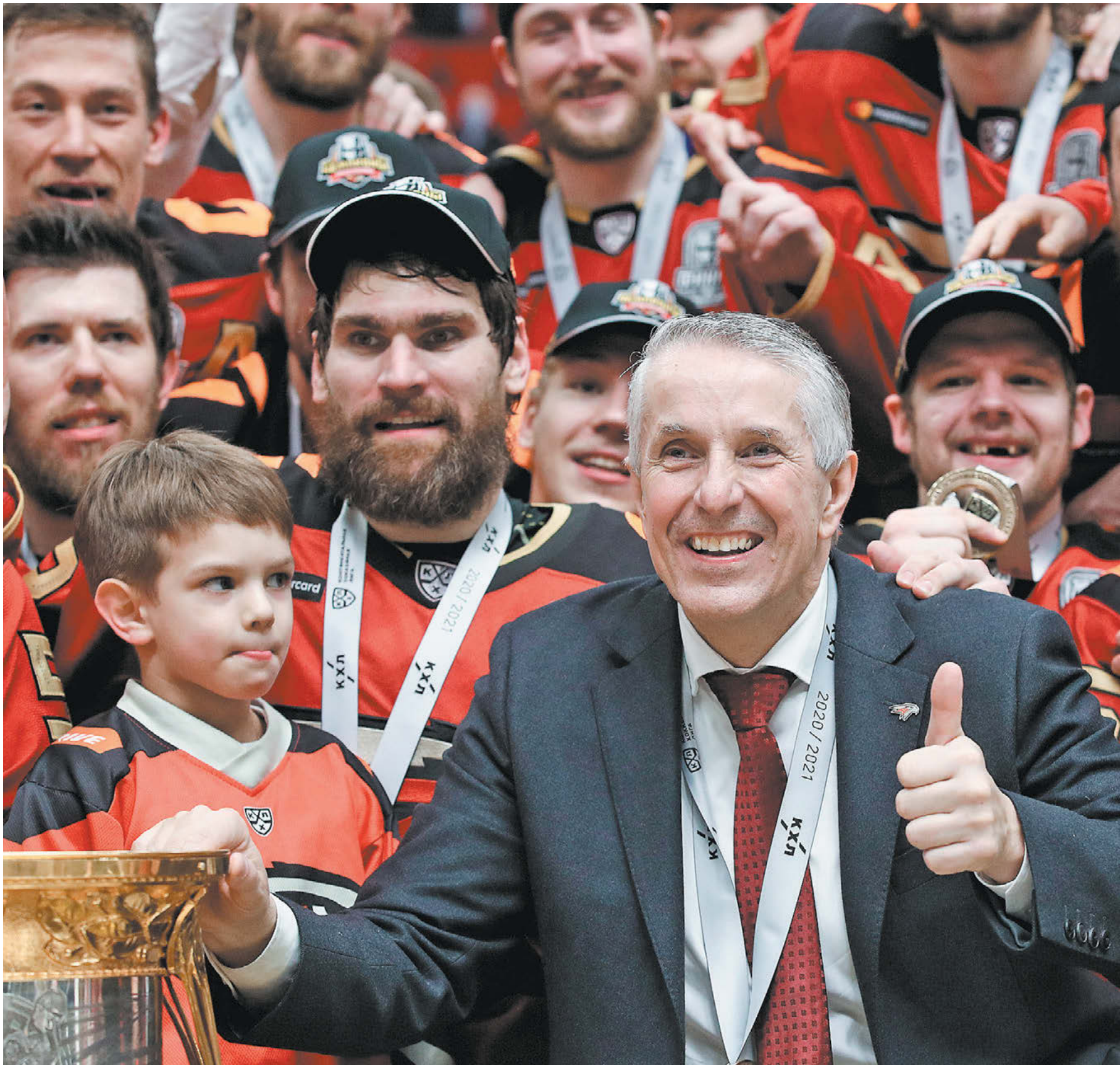
28 апреля 2021 года. Балашиха. «Авангард» – ЦСКА – 1:0. Главный тренер омичей Боб Хартли с Кубком Гагарина

Как уже сообщал «СЭ», 62-летний канадский специалист, работавший в «Авангарде» с 2018 по 2022 год, вернется на должность главного тренера омского клуба