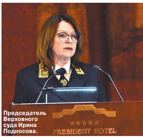
Председатель Верховного суда Ирина Подносова.