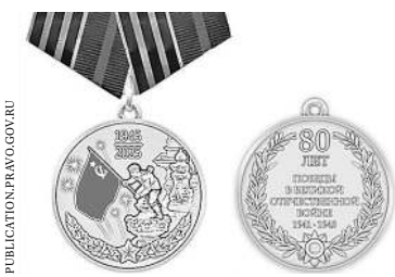
Так выглядит медаль к 80-летию Победы.

«Единовременные выплаты ко Дню Победы ветеранам Великой Отечественной войны, непосредственно принимавшим участие в боевых действиях, увеличены с 50 до 200 тысяч рублей. Участники обороны и освобождения Крыма дополнительно к этой сумме получат по 100 тысяч рублей в апреле, а партизаны и подпольщики — ко Дню партизан и подпольщиков, который отмечается в июне».