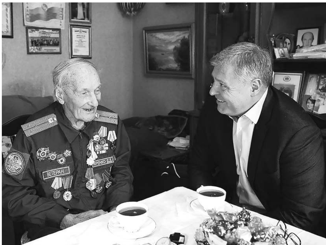
ПРЕСС-СЛУЖБА ГУБЕРНАТОРА АСТРАХАНСКОЙ ОБЛАСТИ

О том, какие мероприятия стоит ждать астраханцам и го-