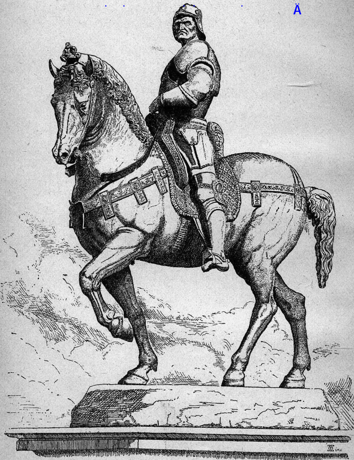
Bartolomeo Colleoni, Statue von Andrea Verrocchio zu Venedig. (Nach Perkins.)