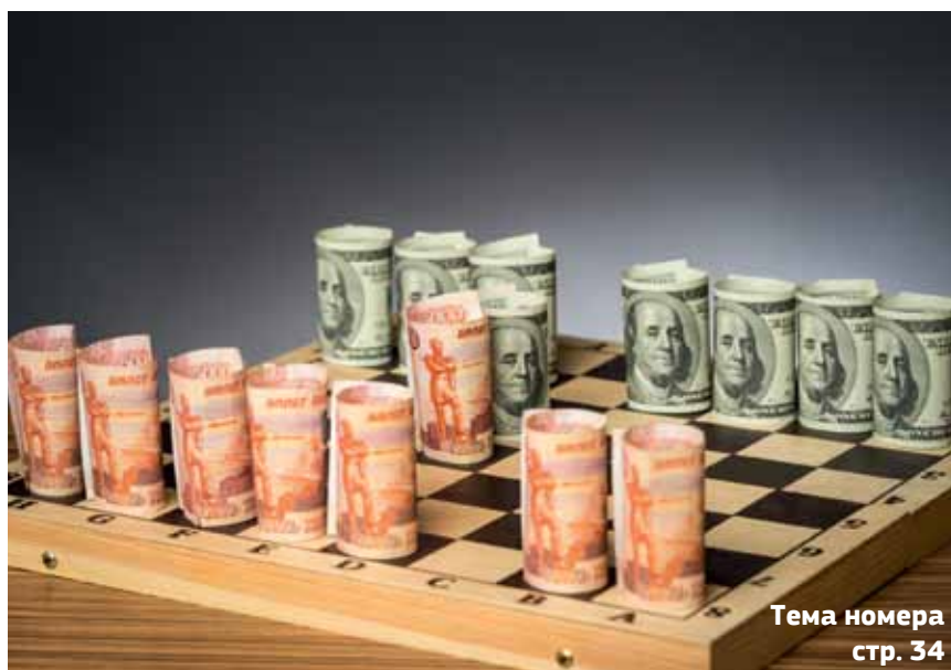
Тема номера стр. 34